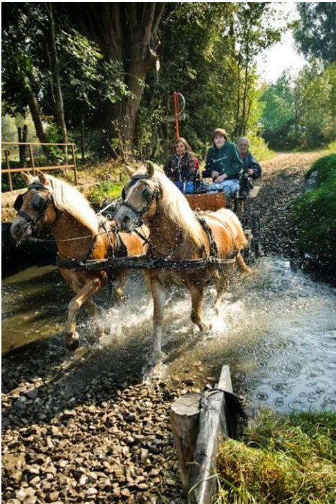
Doorwaadbare plaats ruiter- en menroute De Hel, Vissenaken