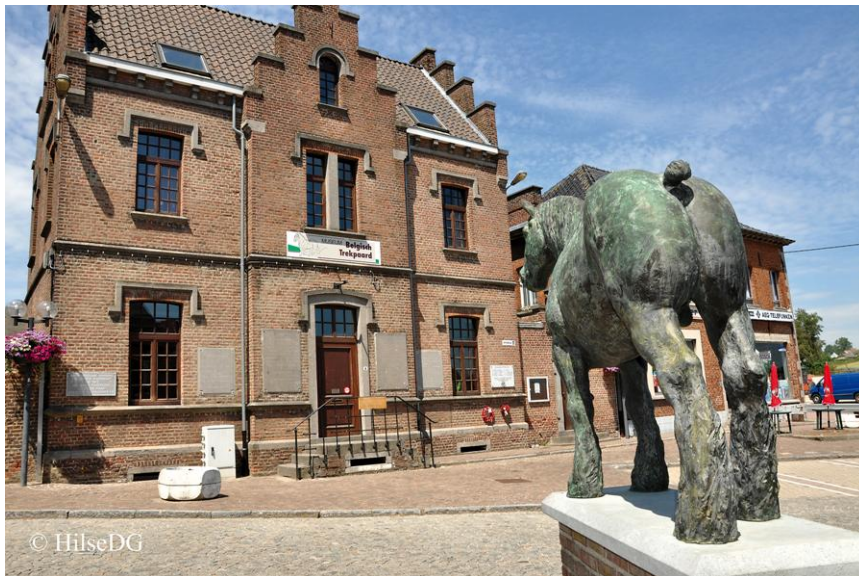
Museum Belgisch Trekpaard met standbeeld van Brillant

Bakermat van het Brabants Trekpaard liggen in Vollezele, Galmaarden