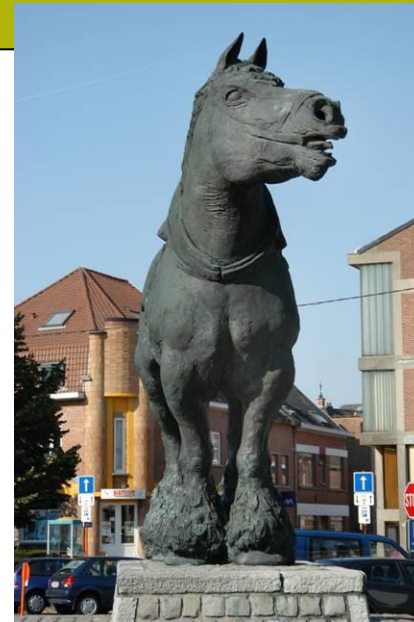
Prins in Sint-Kwintens-Lennik