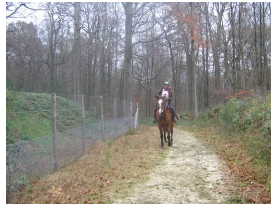
Oversteek Ecoduct Warandepad