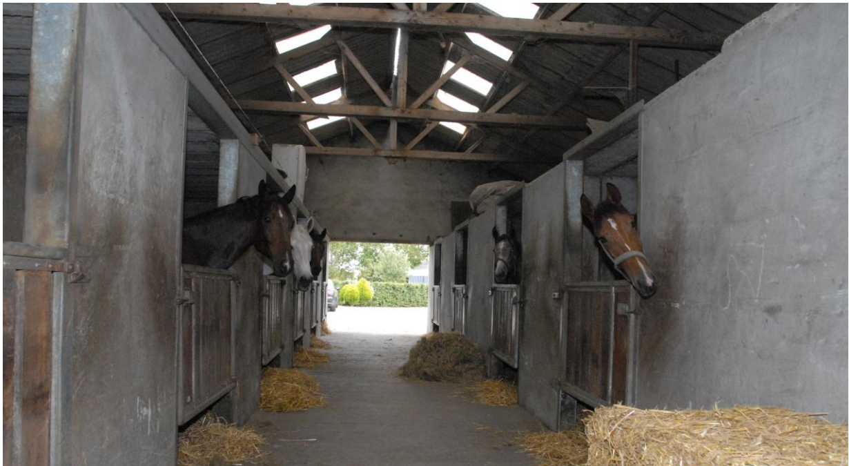
Figuur 15

Centra voor winning en opslag van sperma, eicellen en embryo's moeten aan een aantal opgelegde normen voldoen om een sanitaire erkenning te bekomen. Zo worden er heel wat vereisten gesteld aan de infrastructuur die in de meeste gevallen ruimer en uitgebreider dient te zijn dan gebruikelijk. Uiteraard is een sanitaire erkenning noodzakelijk voor de uitbating van dergelijke centra. Het bedrijf moet daarom ook de nodige vergunningen kunnen verkrijgen voor een aanpassing van de bestaande gebouwen om te beantwoorden aan de sanitaire infrastructuurvereisten. Bij de beoordeling van dergelijke dossiers worden uiteraard de wettelijke normen van de erkenning gerespecteerd op voorwaarde dat de erkenningsaanvraag effectief wordt ingediend of reeds lopende is.