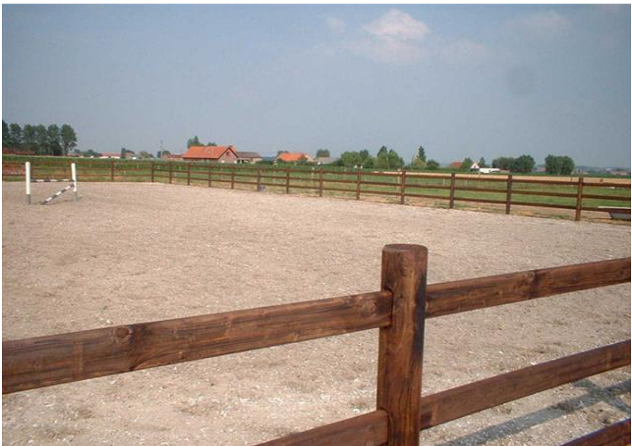
Figuur 11 Buitenpiste

In tegenstelling tot de aanvraag voor een buitenpiste is het voor de aanvraag van een binnenpiste noodzakelijk dat de aanvrager een leefbaar bedrijf uitbaat (zie verder) en de noodzakelijkheid van de binnenpiste kan aantonen. Deze voorwaarde geldt echter enkel wanneer de aanvrager de binnenpiste als een volledig nieuw bedrijfsgebouw wil inplanten. Wanneer een voormalige loods bijvoorbeeld via een functiewijziging wordt omgezet naar een binnenpiste, moet aan deze voorwaarde niet voldaan worden. Meer informatie over nieuwe gebouwen, uitbreidingen, functiewijzigingen en volwaardigheid van een bedrijf is in onderstaande tekst terug te vinden.