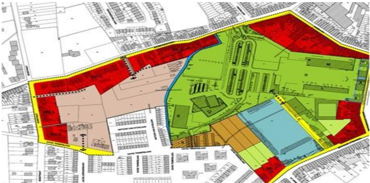
Figuur 2 Ruimtelijk Uitvoeringsplan

Daar gewestplannen en plannen van aanleg statische plannen zijn, werd een vijftiental jaren geleden gezocht naar een meer dynamische vorm van planning, die meer rekening hield met maatschappelijke tendensen: de ruimtelijke structuurplannen. Een ruimtelijk uitvoeringsplan (RUP) is een plan in uitvoering van een ruimtelijk structuurplan waarmee de overheid in een bepaald gebied de bodembestemming vastlegt. Momenteel worden geen BPA's meer opgemaakt, maar RUP's. Ze worden opgemaakt op drie niveaus: gewestelijk, provinciaal en gemeentelijk. In 1997 werd het eerste Ruimtelijk Structuurplan Vlaanderen goedgekeurd, sinds 2004 heeft elke provincie een provinciaal ruimtelijk structuurplan en op dit ogenblik beschikt het grootste deel van de gemeenten over een gemeentelijk ruimtelijk structuurplan.