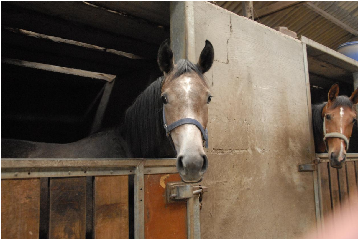
Figuur 9

Het planologisch attest is een instrument dat aan deze bestaande zonevreemde bedrijven een ruimtelijke oplossing kan bieden. Deze zonevreemde bedrijven hebben immers moeilijkheden om stedenbouwkundige vergunningen in functie van het bedrijf te bekomen. Zonevreemde bedrijven kunnen enkel een beroep doen op het planologisch attest indien ze stedenbouwkundig hoofdzakelijk vergund en niet verkrot zijn (gebouwen, constructies, verhardingen en functie) en indien het een bestaand bedrijf betreft. De bevoegde overheid geeft dan het planologisch attest af met expliciete vermelding van een opmaak of wijziging van een ruimtelijk uitvoeringsplan. Meestal worden dergelijke zonevreemde bedrijven vervolgens opgenomen in een Ruimtelijk Uitvoeringsplan “zonevreemde recreatie” of “zonevreemde bedrijven”.