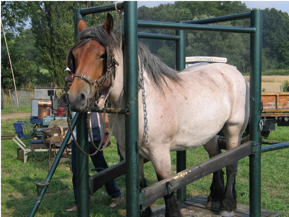
Figuur 8

In de praktijk is voor de adviezen van de afdeling Duurzame Landbouwontwikkeling met betrekking tot een nieuwe inplanting van bedrijfsgebouwen op een onbebouwd perceel enkel het onderscheid tussen 'leefbaar agrarisch bedrijf' en de groep 'nevenberoepslandbouwbedrijf, gelegenheidslandbouwbedrijf, hobbylandbouwbedrijf' relevant. Nieuwe inplantingen en bedrijfswoningen worden enkel aanvaard voor leefbare agrarische bedrijven. Alle andere bedrijven worden verwezen naar bestaande inplantingen; de woning bij die bedrijven valt onder de normen voor een zonevreemde woning. Aanvragers die beroepsmatig een landbouwbedrijf uitbaten kunnen te allen tijde uitbreiden met de voor hun bedrijvigheid aantoonbare noodzakelijke (agrarische) bouwwerken.