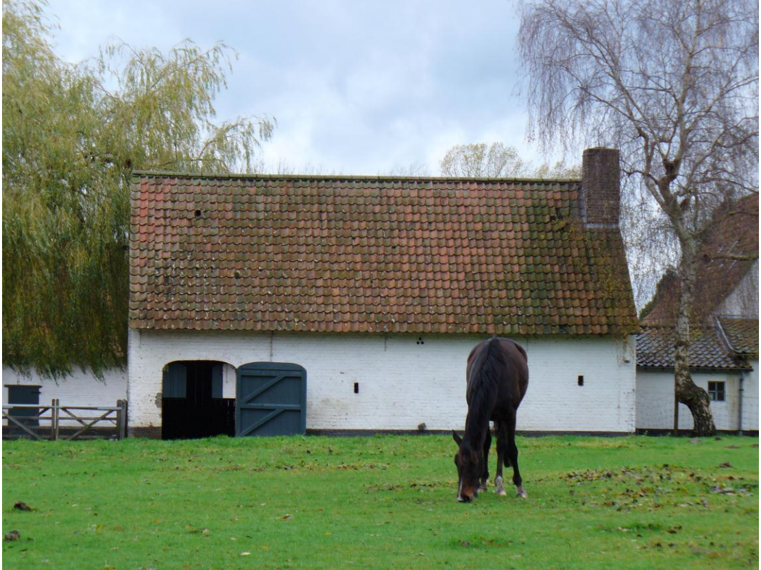
Figuur 3