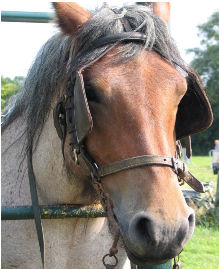
Figuur 6

Een stedenbouwkundige vergunning is ook nodig als de hoofdfunctie van een gebouw of een gedeelte van een gebouw gewijzigd wordt, zelfs al worden er geen werken uitgevoerd. Wonen, verblijfsrecreatie, dagrecreatie, landbouw in de ruime zin, handel, horeca, kantoorfunctie en diensten, industrie en ambacht, gemeenschapsvoorzieningen en openbare nutsvoorzieningen worden als hoofdfunctie beschouwd. Een stedenbouwkundige vergunning is steeds nodig als het gaat over een bedrijfswoning die geen binding meer heeft met de bedrijfsactiviteit (bv. in het agrarisch gebied een hoeve gebruiken als woning voor een niet-landbouwer).