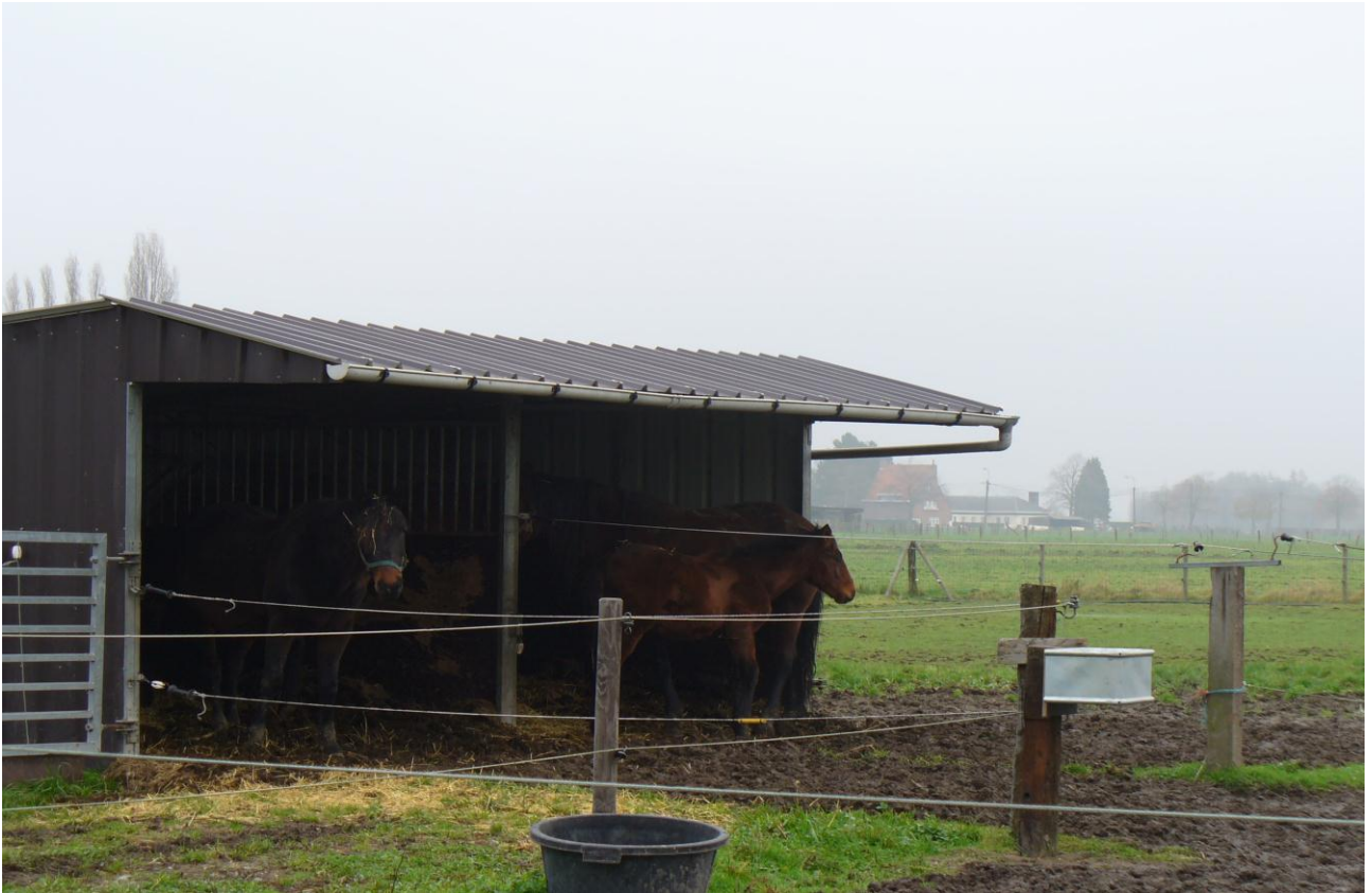
Figuur 4 Schuilhok

De omzendbrief vermeldt verder nog waar stallingen en schuilhokken dienen te worden ingeplant: