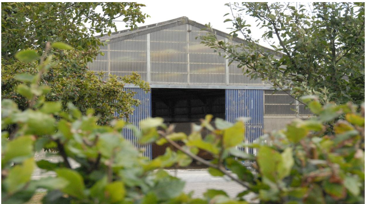
Figuur 10 Binnenpiste

Naast paardenstallen worden er ook vaak stedenbouwkundige aanvragen ingediend voor buitenpistes en binnenpistes. Voor een professionele paardenhouderij zijn dergelijke pistes belangrijk omdat daar de paarden verder getraind worden. Vanuit ruimtelijk oogpunt bestaat er een groot verschil tussen een binnenpiste en een buitenpiste. Wanneer de aanleg van een buitenpiste gepaard gaat met een reliëfwijziging en/of het oprichten van constructies, is het verplicht om een stedenbouwkundige vergunning aan te vragen. Binnenpistes zijn altijd onderhevig aan de vergunningsplicht.