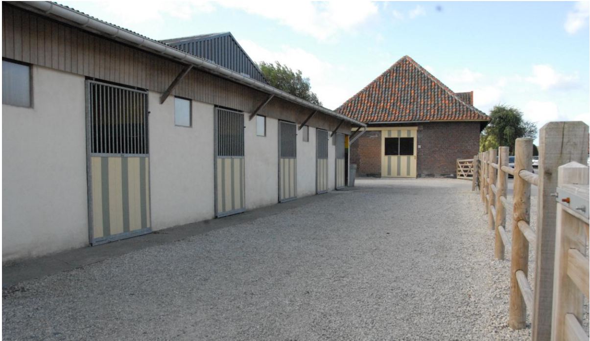
Figuur 13

gebouwencomplex zonder enige woonfunctie kan eveneens voor verscheidene landbouw- en landbouwaanverwante activiteiten gebruikt worden. Wanneer bij dergelijke gebouwencomplexen de aanvrager echter een woning wil bouwen, moeten de gestelde voorwaarden die gelden voor een nieuwe inplanting (o.a. landbouwer in hoofdberoep, leefbaar bedrijf) vervuld zijn.