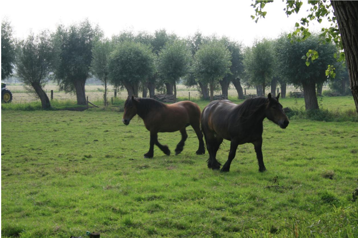
Figuur 12