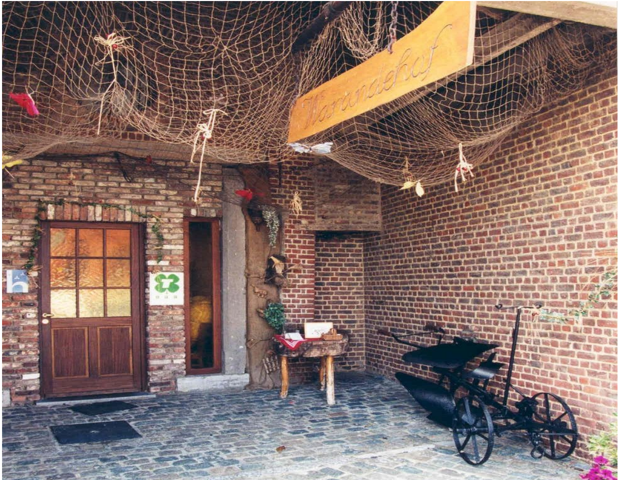
Figuur 14

Bestaande gebouwen in het agrarisch gebied kunnen onder bepaalde voorwaarden omgevormd worden tot een verblijfsgelegenheid. Afhankelijk van de activiteiten op het (landbouw)bedrijf, spreken we over hoevertoerisme of plattelandstoerisme. Het ruitertoerisme is hier een specifieke vorm van, aangeboden door bedrijven die zich op de paardensector hebben toegespitst. Het verblijf kan meestal worden gecombineerd met paardrijden en alle mogelijke varianten daarvan maar vaak bestaat er zelfs de mogelijkheid om ook het eigen paard te laten overnachten in de stallen op het bedrijf.