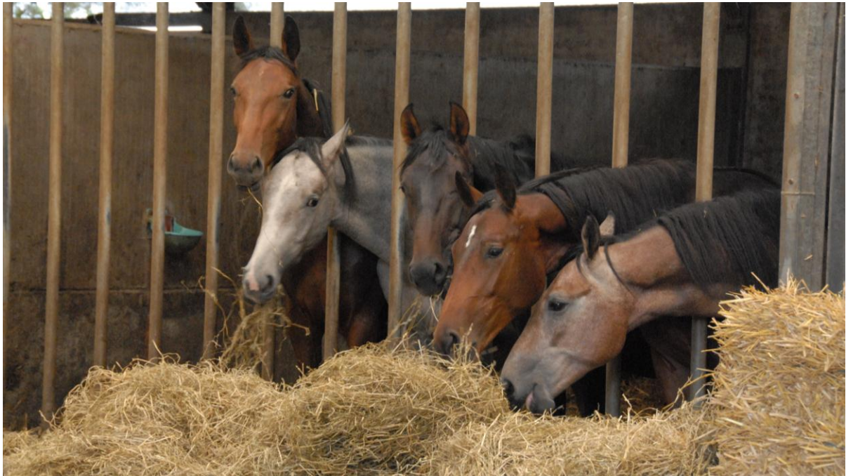
Figuur 7