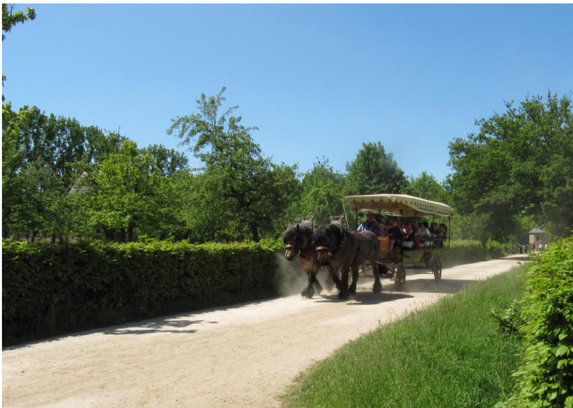
Figuur 5

Bij een stedenbouwkundige vergunningsaanvraag moet de gemeente meestal meerdere adviserende instanties om advies vragen. Een gunstig of ongunstig advies van de afdeling Duurzame Landbouwontwikkeling biedt bijgevolg geen garantie op het al dan niet verkrijgen van een stedenbouwkundige vergunning voor de aanvraag. Het College van burgemeester en schepenen dient immers rekening te houden met de adviezen van alle adviserende instanties die werden aangeschreven. Wanneer deze adviezen niet gevolgd worden moeten ze gemotiveerd weerlegd worden.